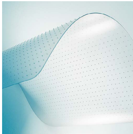
Für Teppichböden mit Ankernoppen

Der Bürostuhl gleitet perfekt – sowohl über Hartböden als auch Teppichböden. Die leistungsstarke, thermisch-verschweisste VAB®-Haftschicht sorgt auf Hartböden dafür, dass ein Verrutschen der Matte ausgeschlossen ist. Auf Teppichböden sorgen stumpfe Ankernoppen für Halt, die in den weichen Flor greifen.